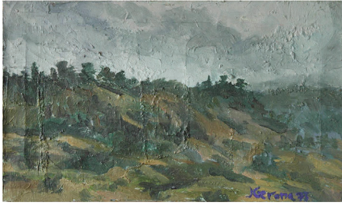
Vista des de Castellar (1973) 27 x 45,5 cm. Oli sobre tela