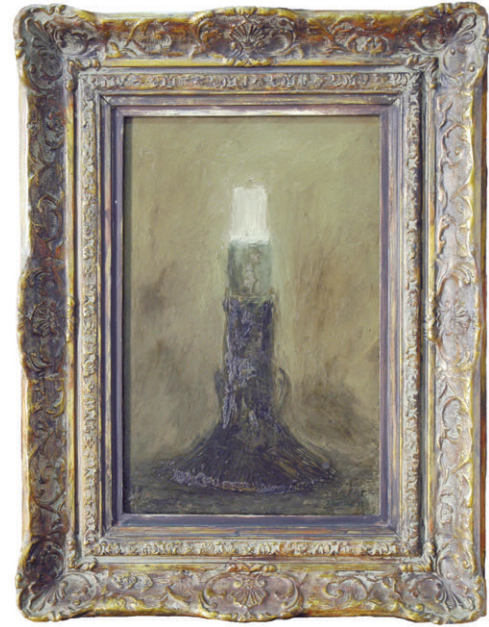
Canelobre fosc (1992) 41 x 27 cm. Oli sobre tela