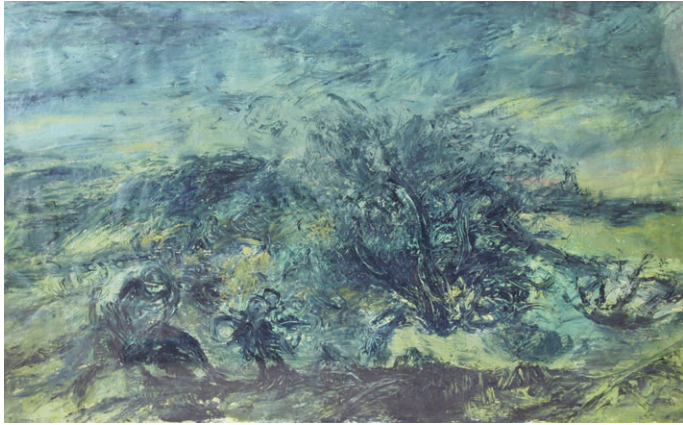
Lector i paisatge (1993) 98 x 155 cm. Oli sobre paper