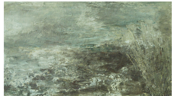
Paisatge del llac Naroch (1995) 30 x 50 cm. Oli sobre tela