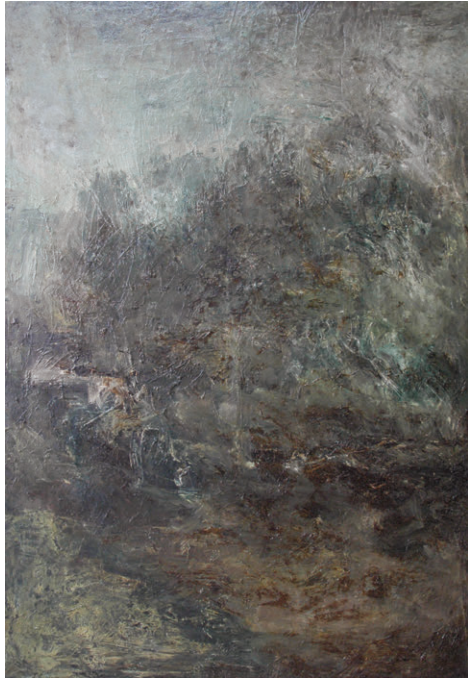
La orilla del baño de Sorfos (1998) 162 x 114 cm. Oli sobre tela