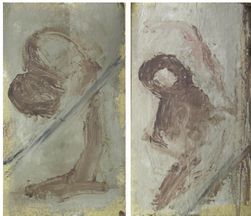
Parella (2005) 37 x 21 cm. c.u. Oli sobre cartró