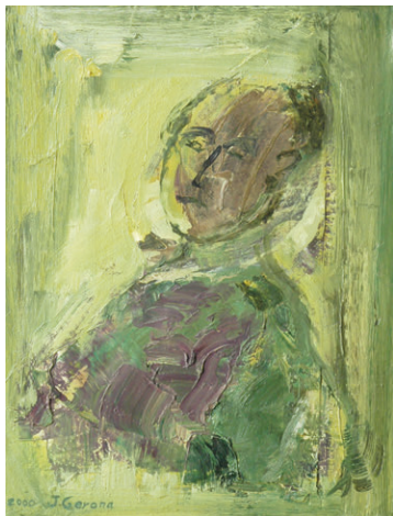
Autoretrat (2000) 41 x 34 cm. Oli i collage sobre tela