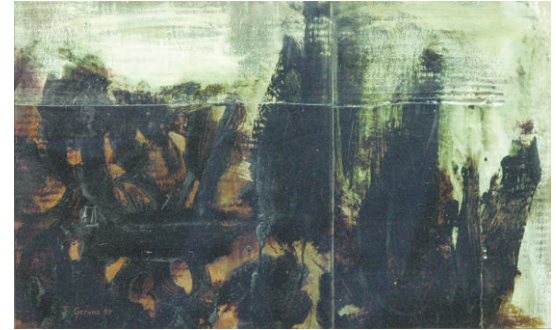
Homenatge a Joan Oliver I - II (1999) 38 x 60 cm. Oli sobre cartró