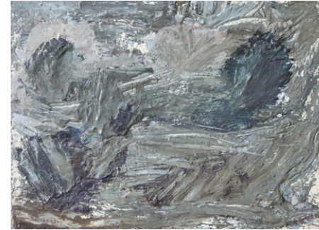
Paisatge (1994) 30 x 40 cm. Oli sobre tela