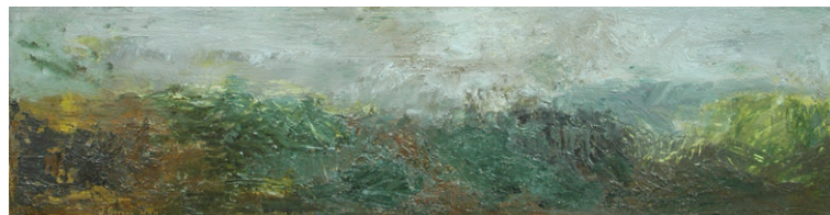
Paisatges foscos: pel camí de Vilanova I-II (2002) 28 x 110 cm. Oli sobre fusta